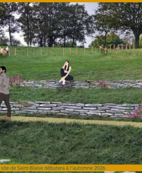
site de Saint-Blaise débutera à l'automne 2026