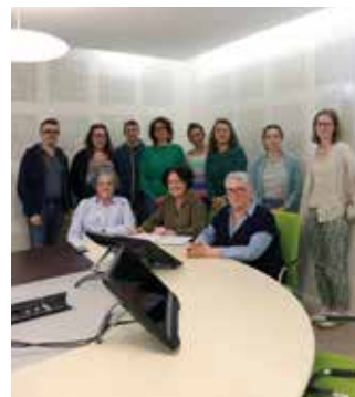
La commission Enfance, Jeunesse, Parentalité lors de son installation

Les commissions sont composées de 8 conseillers municipaux de la majorité et un conseiller municipal de chaque liste minoritaire. En lien avec les services municipaux, les commissions préparent les projets qui seront soumis au bureau municipal puis au conseil municipal.