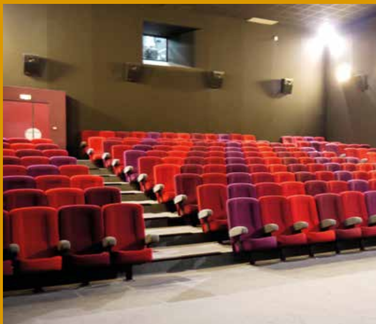
Les fauteuils et la moquette du cinéma le Maingué seront remplacés