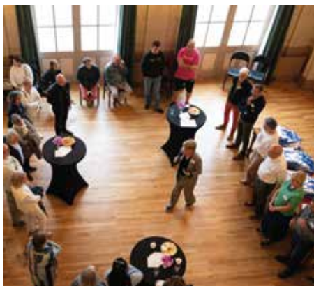
Lors de la cérémonie d'accueil des nouveaux habitants en octobre 2025

Vous avez emménagé sur Segré-en-Anjou-Bleu entre septembre 2025 et jusqu'en septembre 2026 ?