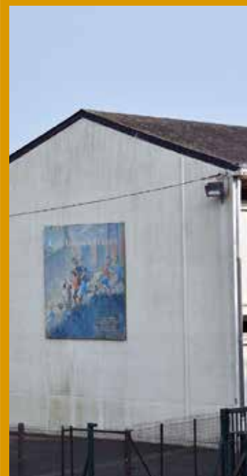
Pose de panneaux photovoltaïques - école