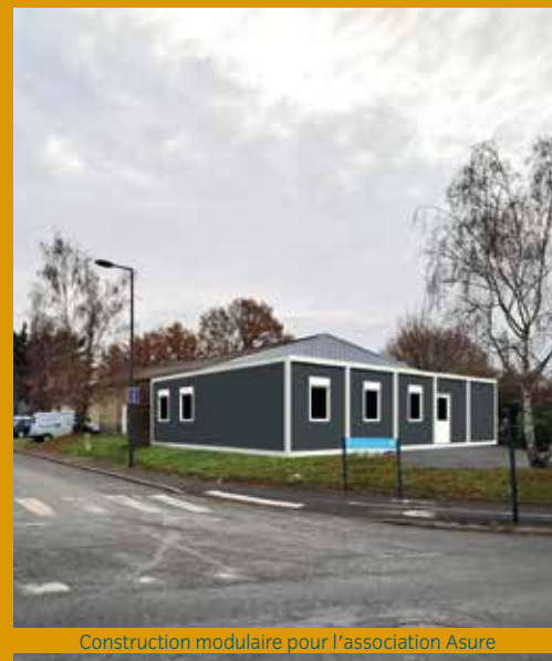
Construction modulaire pour l'association Asure