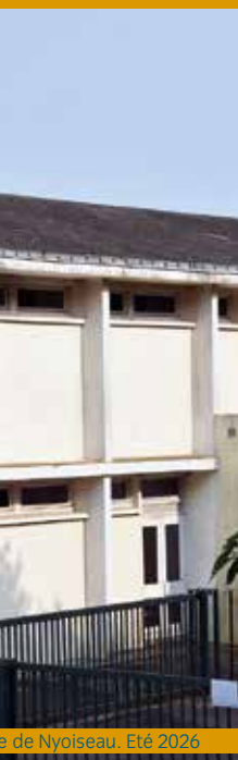
de Nyoiseau.. Été 2026