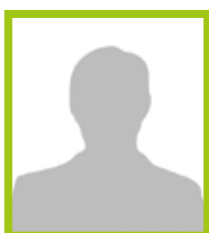
Benjamin HUCHEDE Nyoiseau