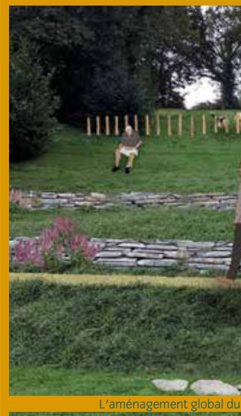
L'aménagement global du