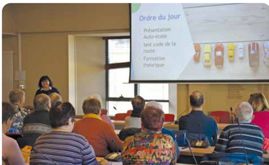
Réactualisation du code de la route lors d'une session en 2023.

ccas@segreenanjoubleu.fr segreenanjoubleu.fr