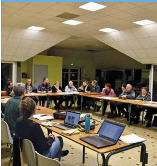
Photo ci-contre : les membres du groupe de travail lors d'une réunion préparatoire en mars 2025.

+ d'information sur www.segreenanjoubleu.fr