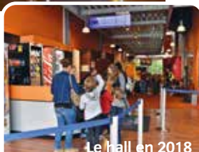
Le hall en 2018

Le cinéma se dote également de lunettes 3D. En 2018, le hall d'accueil bénéficie d'un réaménagement et de l'installation de l'affiche dynamique et propose la vente de confiseries. En 2023, une billetterie en ligne a été instaurée.