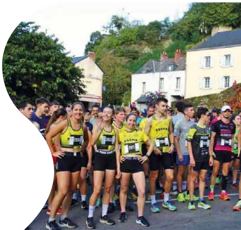
Les participant.es au départ du défi urbain 2024