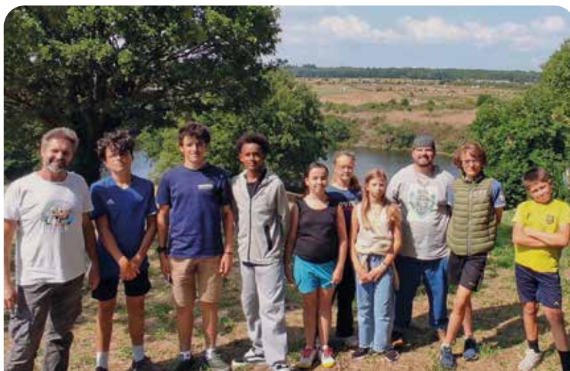
Le FLEP lors d'une animation à l'aire de loisirs de Saint-Blaise à Noyant-la-Gravoyère

Des navettes en minibus sont également possibles pour rejoindre l'espace jeunesse ou les sorties dans les autres communes déléguées.