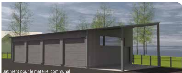
Bâtiment pour le matériel communal

Pour les communes déléguées d'Aviré, La Ferrière-de-Flée, Louvainnes, Montguillon, Saint-Martin-du-Bois et Saint-Sauveur-de-Flée, la commune a fait le choix de regrouper l'ensemble des ateliers municipaux dans un seul lieu commun.