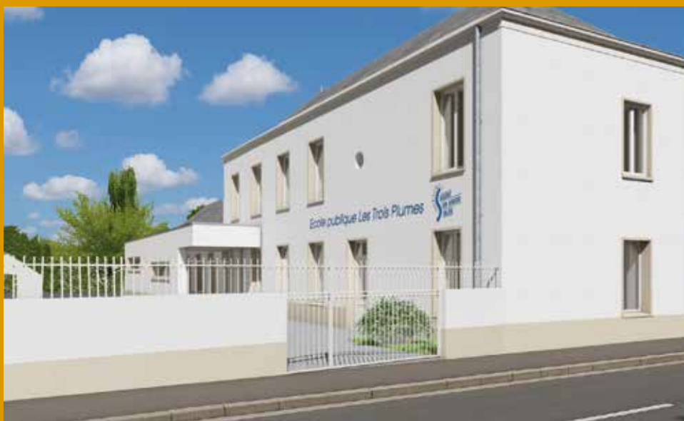
Ecole Les 3 plumes - Saint-Sauveur-de-Flée (esquisse Avant-Projet Définitif par Oxa Architectures)