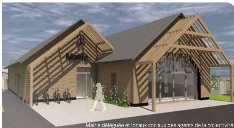
Mairie déléguée et locaux sociaux des agents de la collectivité