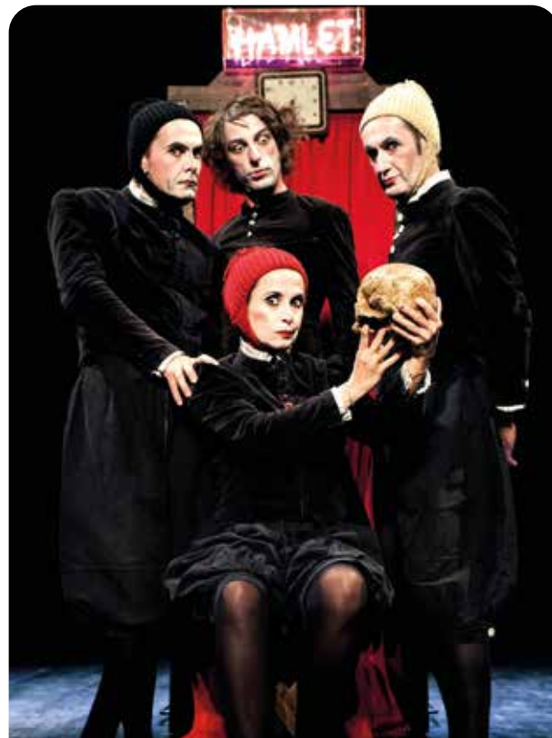
Sur scène, 4 comédiens de la Cie Bruitquicourt de Montpellier.