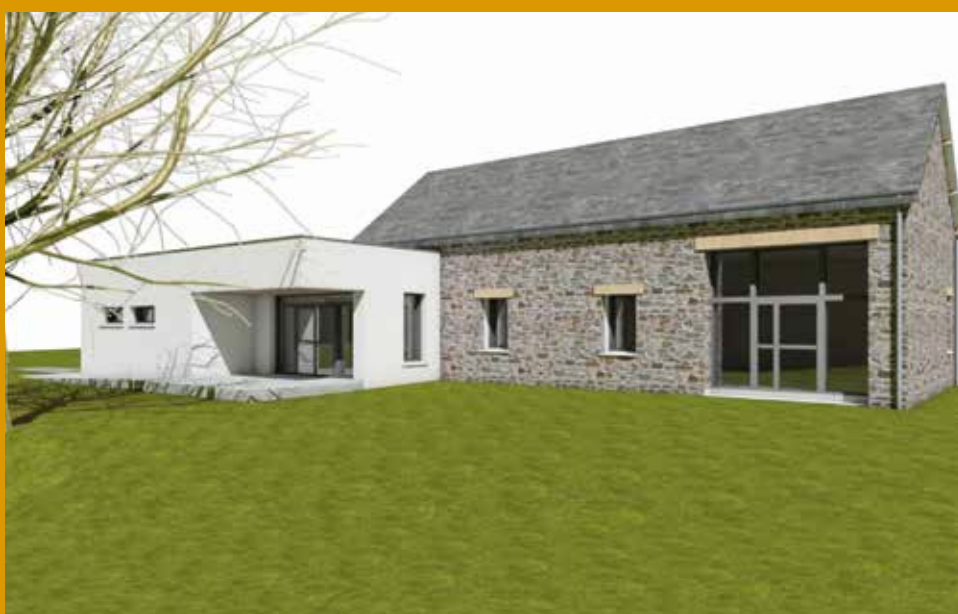
La nouvelle salle des fêtes d'Aviré (esquisse Avant-Projet Définitif par Oxa Architectures)