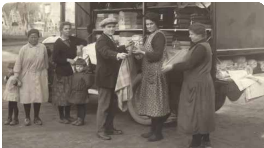
Les tissus Duchêne au Bourg-d'Iré. Le camion Unic, vers 1928.

+ d'infos et calendrier de l'itinérance de l'exposition : www.segreenanjoubleu.fr