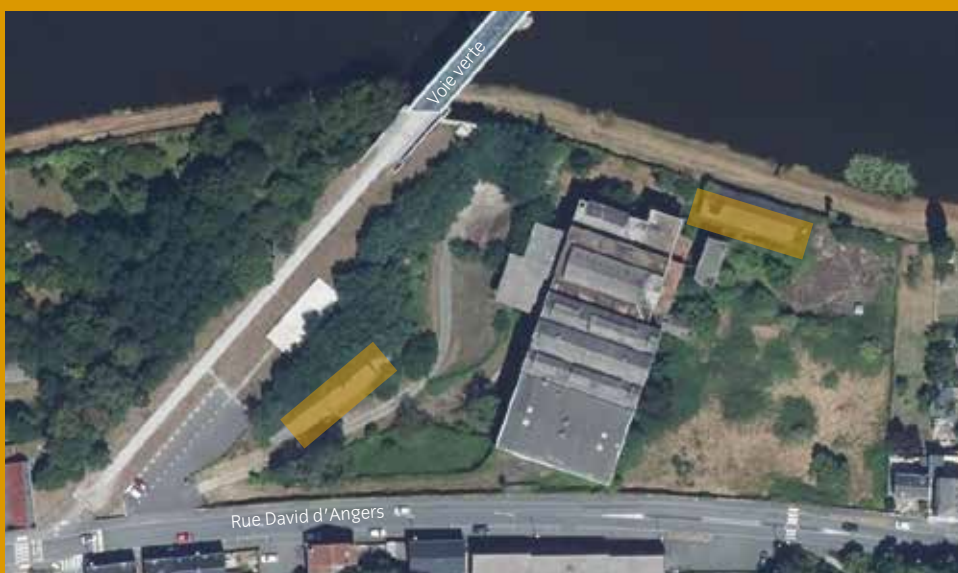
Dépollution/déconstruction d'annexes à l'ancienne usine Paulstra de Segré